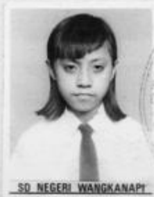
SD NEGERI WANGKANAPI

Pemegang Surat Tanda Tamat Belajar ini terakhir tercatat sebagai siswa pada Sekolah Dasar Negeri Wangkanapi di Kecamatan Wolio Kabupaten Buton dengan Nomor Induk 1538